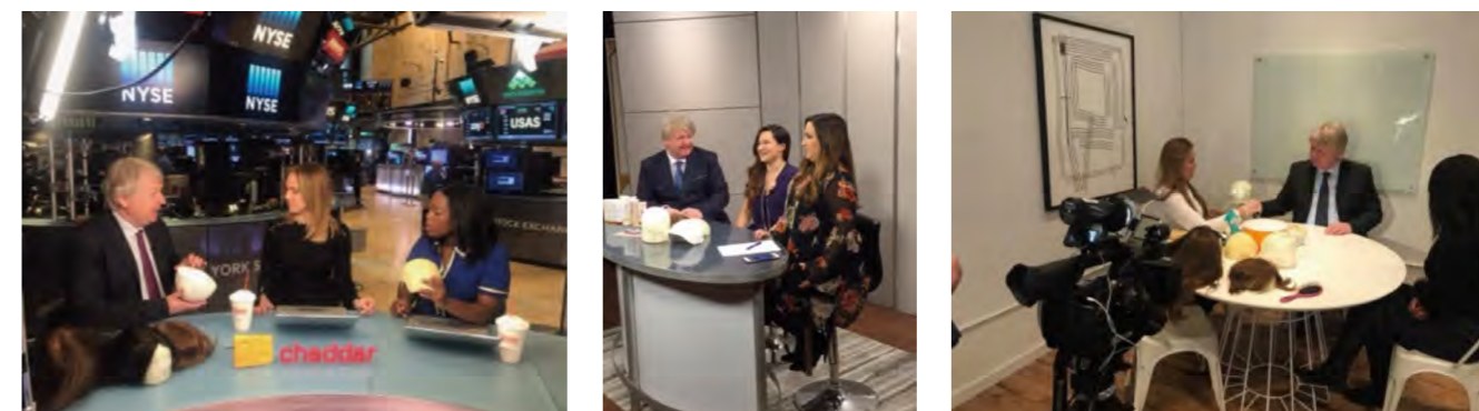
L'Amministratore delegato CRLabs intervistato nei canali televisivi NY1 e NY1 espanol, Cheddar Television presso la sala contrattazione della Borsa di New York (NYSE), e presso gli studi della Rogers Television di Toronto.

Diverse televisioni americane hanno richiesto la nostra partecipazione per parlare del nostro sistema di infoltimento che si sta imponendo in quel mercato altamente competitivo grazie alle proprie qualità, e soprattutto alla funzionalità che permette di svolgere qualsiasi attività dalla doccia allo sport senza paure o imbarazzi o limitazioni ed alla qualità dei propri capelli che ne permettono una grande libertà di styling